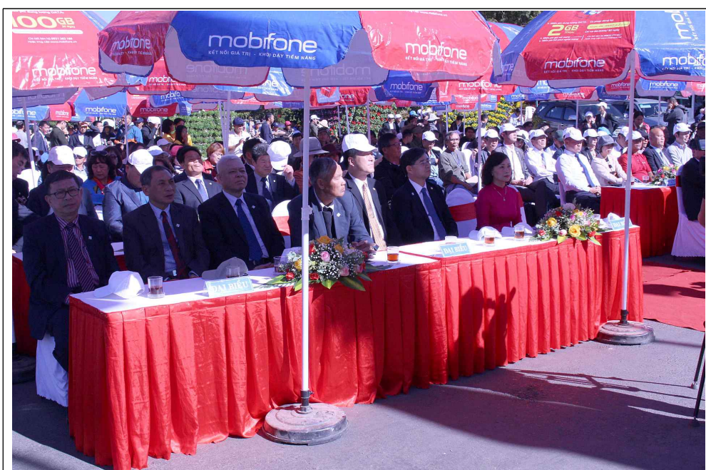
달랏 꽃정원 개막행사 참석