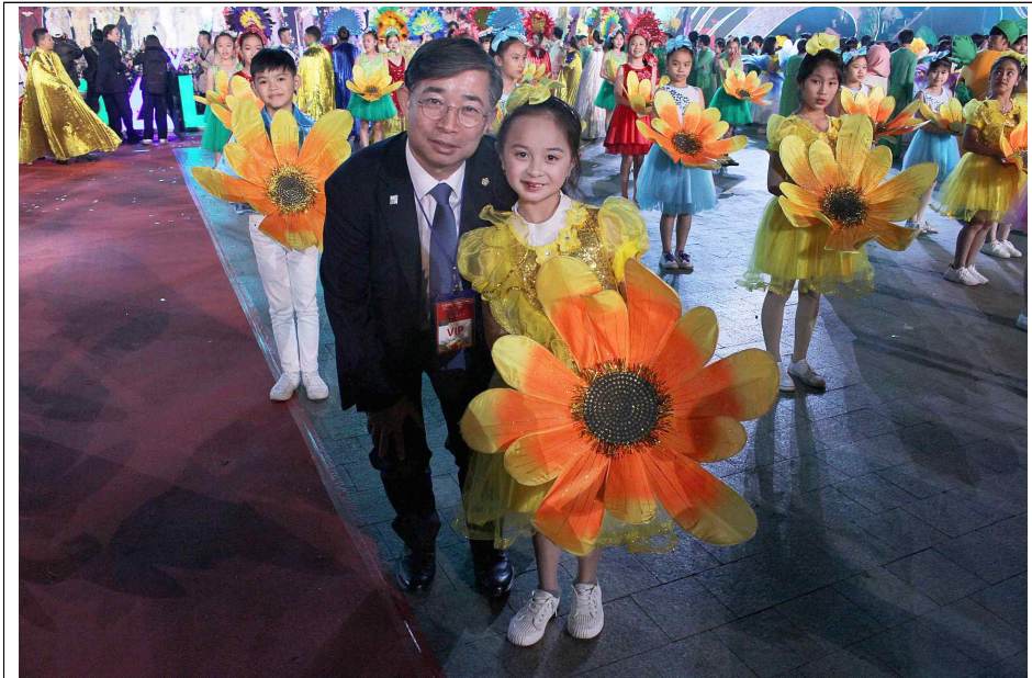
달랏 꽃축제 개막식 참석