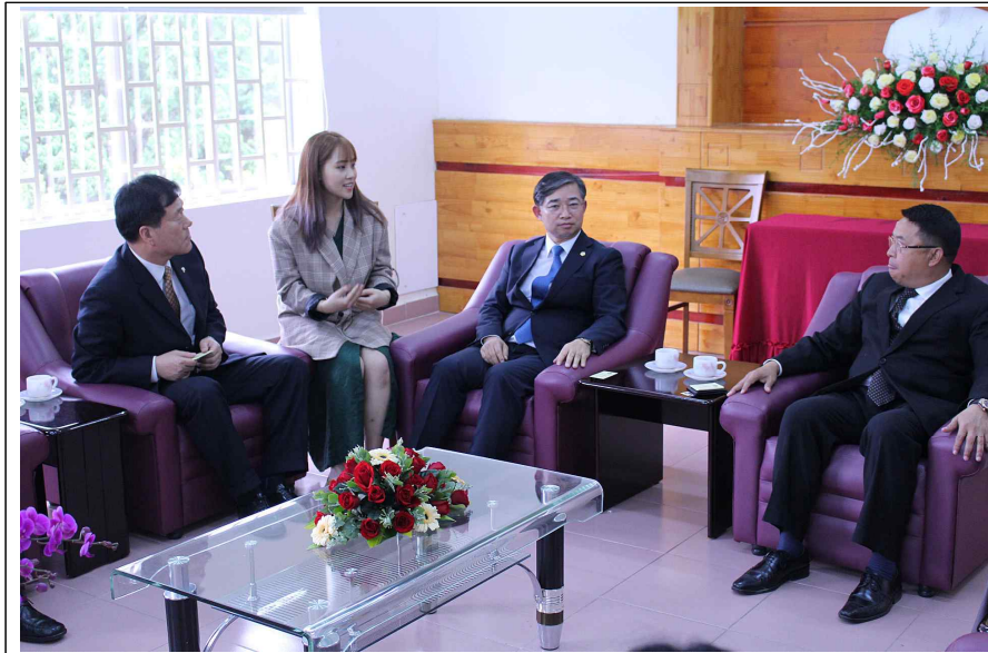
달랏시청 달랏시장 접견