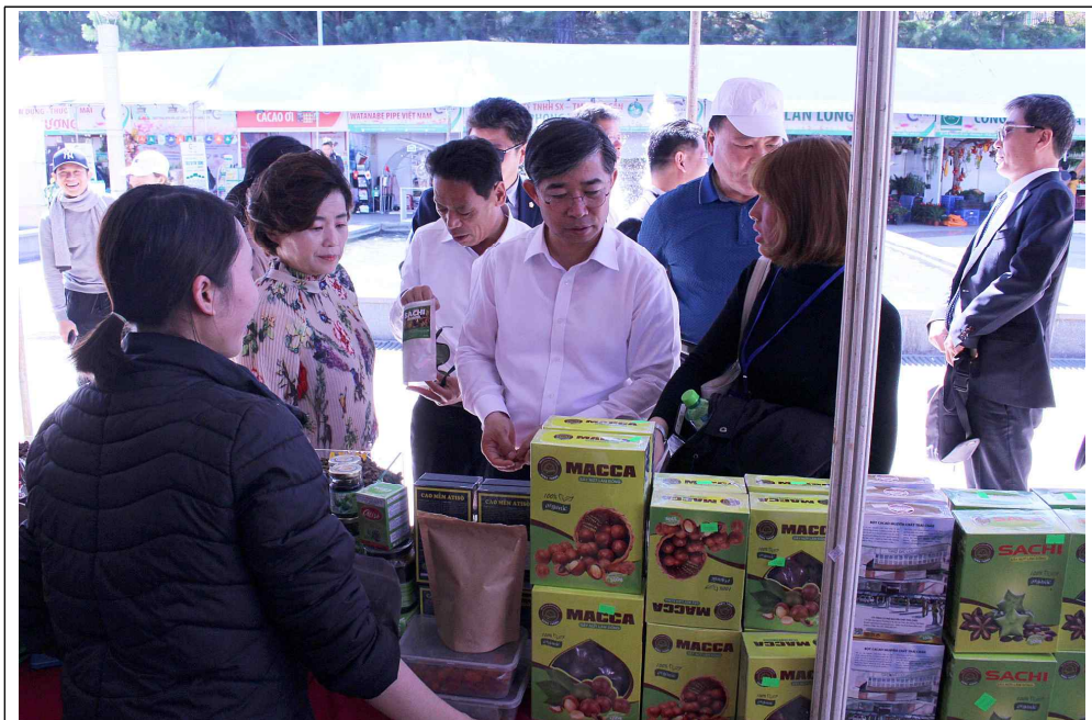
달랏 화훼숲 생명공학조합 방문