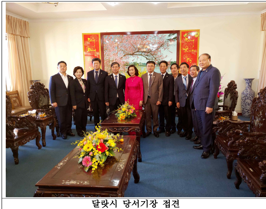
달랏시 당서기장 접견