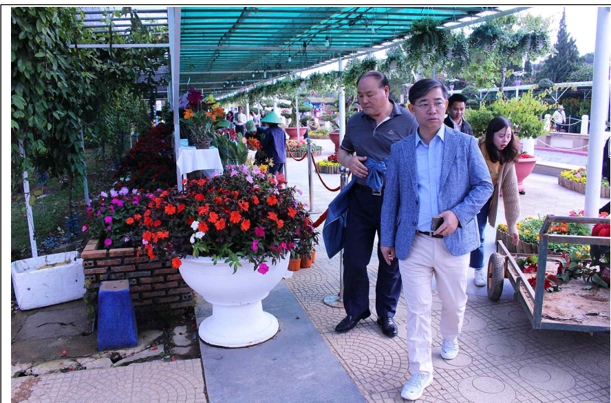
달랏 꽃정원 시찰

○ 시 사 점 : 대단위 규모의 정원과 다양한 꽃을 조성, 우리군 꽃축제장에 접목 필요(관광객의 다양성과 계절별 테마에 맞는 구성 필요)