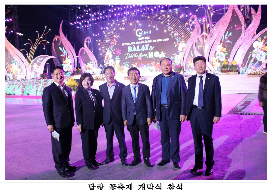
달랏 꽃축제 개막식 참석